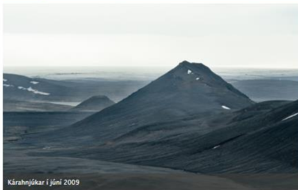
Kárahnjúkar í júní 2009